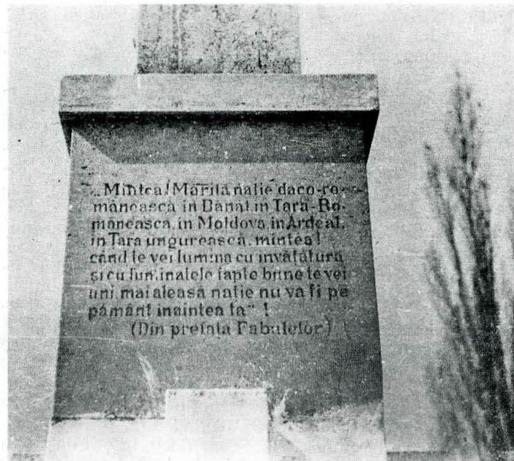
Imagini înfățișînd monumentul ridicat în 1932 la Becicherecu Mic, în memoria cărturarului iluminist Dimitrie Țichindeal

De la cimitir, participanții s-au îndreptat spre locul unde era amplasat monumentul 19 . Presa timișoreană scria: „[...] noi și noi fanfare, alte și alte coruri se adăugau convoiului înșiruit pe drumurile ce duceau la monument [...] Pretutindeni filziiau steagurile, ghirlandele de stegulețe aranjate într-un fastuos decor“ 20 . În jurul monumentului „tribune imense, cu trepte de ființe omenesti, un întreg popor de steaguri ale tuturor societăților corale și fanfarelor, se legănau în entuziasmul general“ 21 .