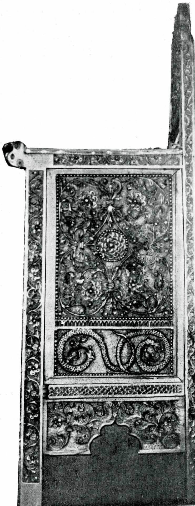
1. Jețul domnesc de la mănăstirea Negru Vodă din Cîmpulung Muscel-detaaliu