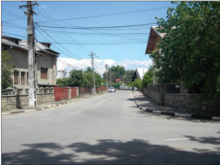
Fig. 1 - Vedere cu partea veche a cartierului Berceni / View of the historical center of Berceni neighborhood

la munte. Autorii Dicționarului Geografic al Județului Prahova (1897) considerau că dintre bisericile existente la sfârșitul secolului al XIX-lea în oraș, cele mai vechi erau: a Berivoeștilor, actualmente având hramul "Sf. Spiridon", și a Bercenilor.