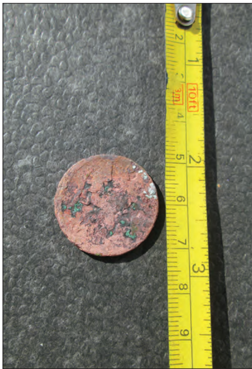
Fig. 5. Revers Monedă