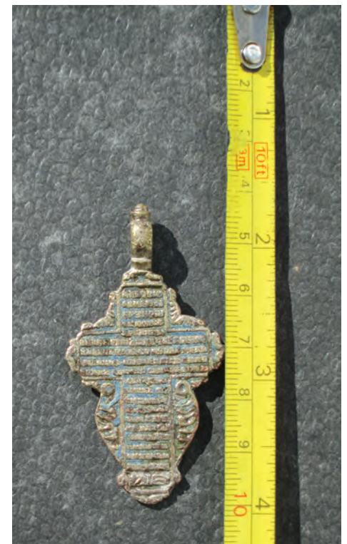
Fig. 4. Reversul Crucii

Животворящий Крест Господень, помогай мне со Святою Госпожою Деву Богородицею и со всеми святыми во все века. Аминь.”