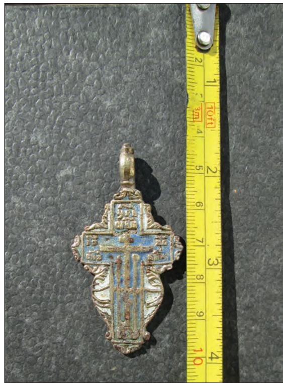
Fig. 3. Aversul Crucii