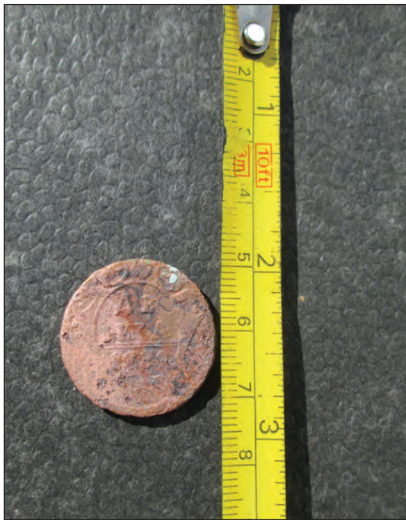
Fig. 4. Avers Monedă

Pe revers se află Vulturul bicefal-simbol imperial 9 , având într-o gheară un sceptru, iar în cealaltă o cruce.